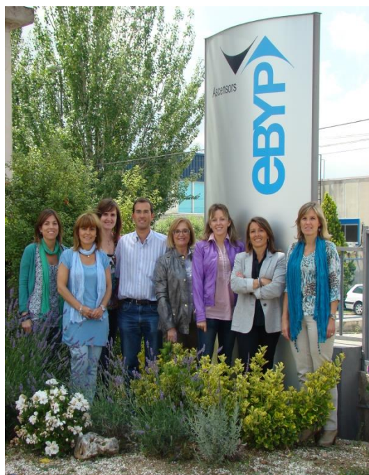
Equip directiu i caps de departament