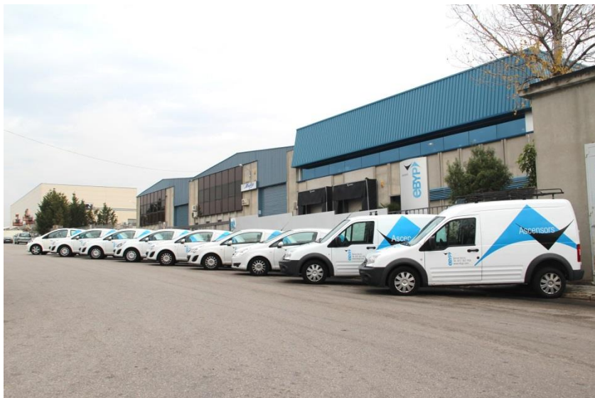
Façana de la seu actual d'Ascensors Ebyyp, S.A.